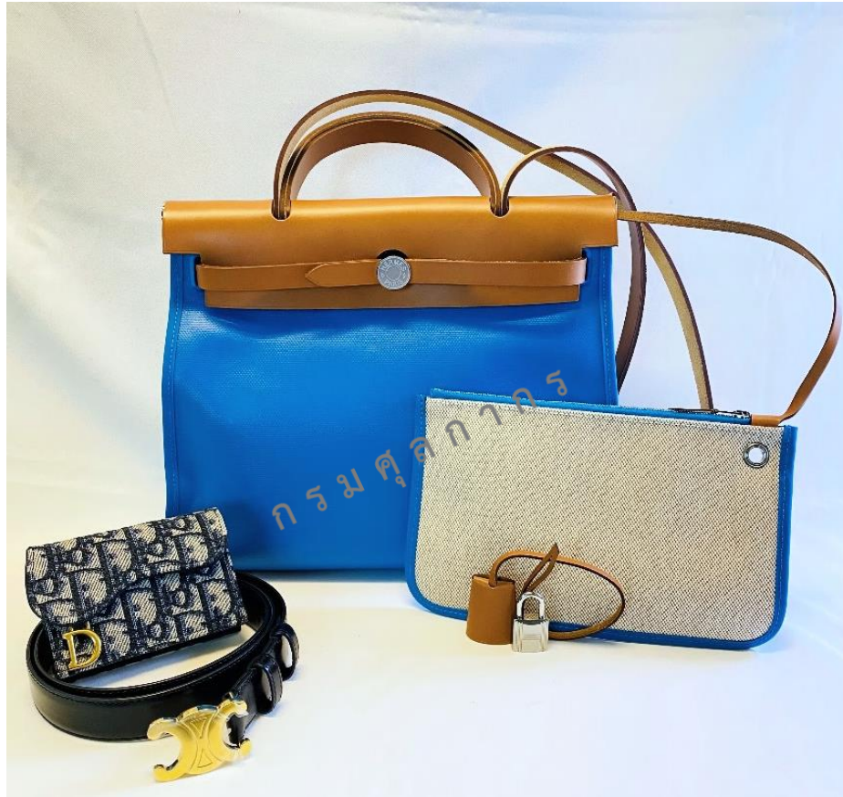
รวม 3 รายการ

เข็มขัด ขนาด 103x2.5 ซม. ยี่ห้อ CELINE พร้อมถุงผ้า