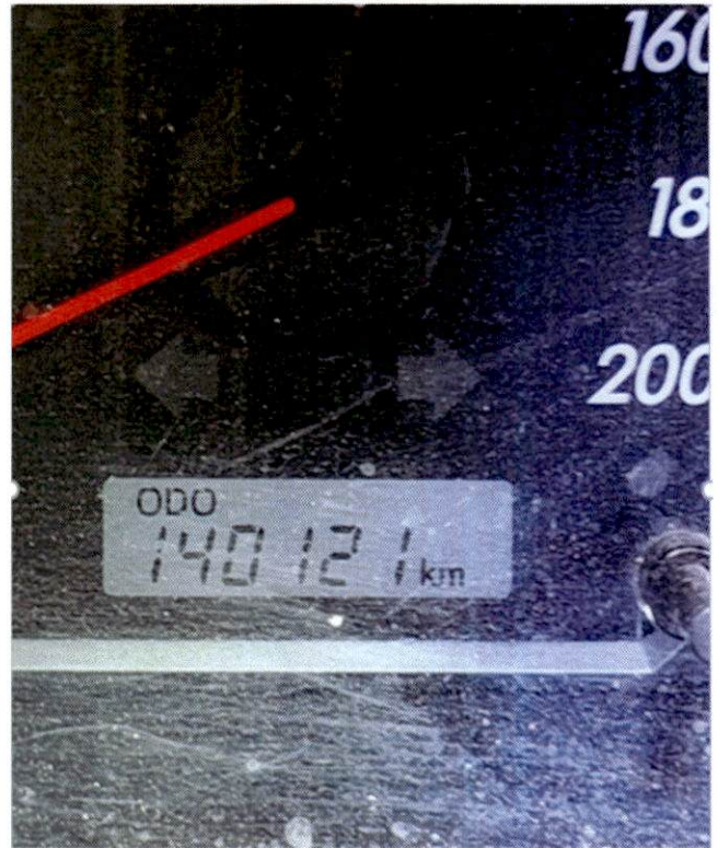
รายการที่ 1 รถยนต์ ทะเบียน กข -3121 นครพนม หมายเลขครุภัณฑ์ กศก.นพ.015