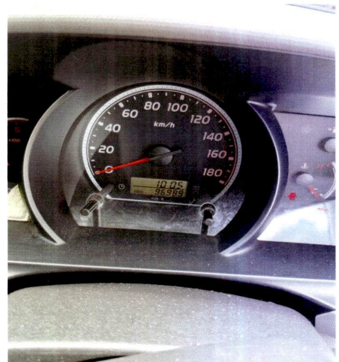
รายการที่ 2 รถตู้ ทะเบียน นข - 1919 นครพนม หมายเลขครุภัณฑ์ กศก.นพ.016