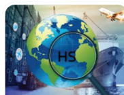
พิกัดอัตราศุลกากร