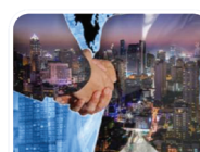
สิทธิประโยชน์ ทางภาษีอากร