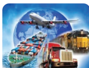
พิธีการศุลกากร