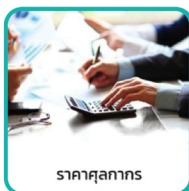
ราคาศุลกากร