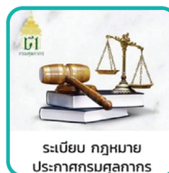
ระเบียบ กฎหมาย ประกาศกรมศุลกากร