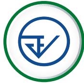
สำนักงานคณะกรรมการ อาหารและยา