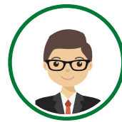
ผู้ประกอบการ