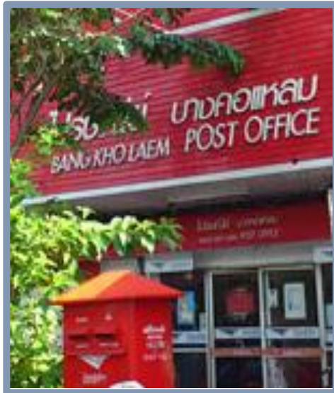
ไปรษณีย์บางคอแหลม