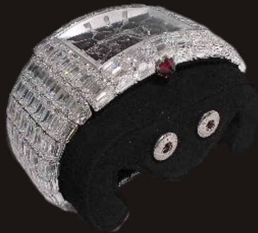
รายการที่ 1 (1 เรือน)