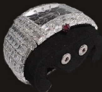
รายการที่ 1 (1 เรือน)