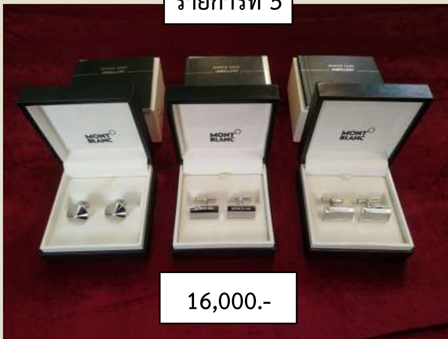
รายการที่ 5