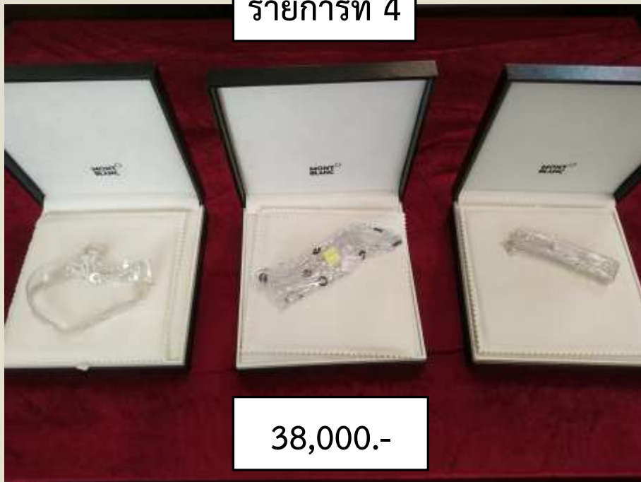
รายการที่ 4