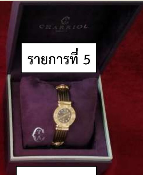
รายการที่ 5