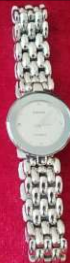
รายการที่ 8