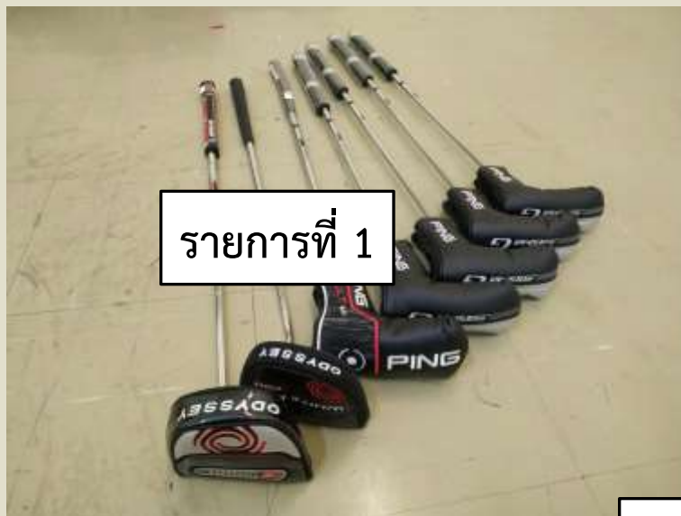
รายการที่ 1