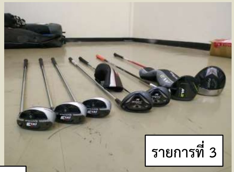
รายการที่ 3