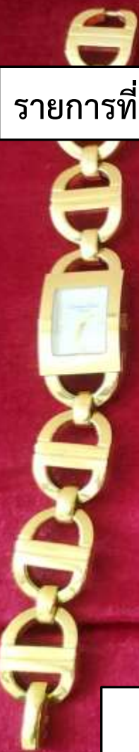
รายการที่ 6