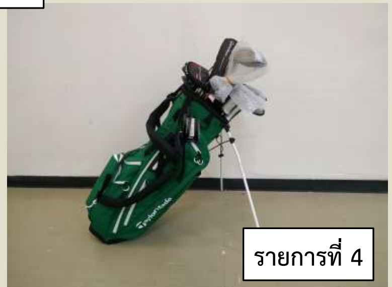
รายการที่ 4