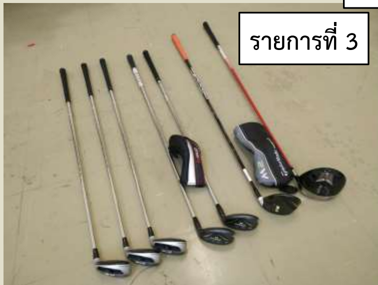
รายการที่ 3