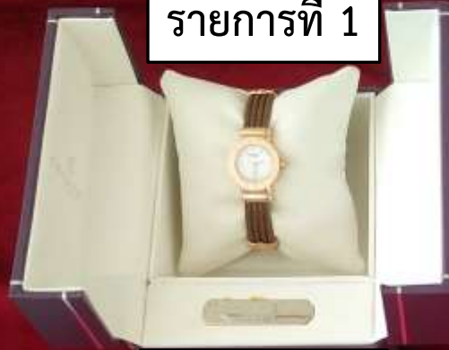
รายการที่ 1