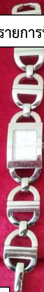
รายการที่ 7