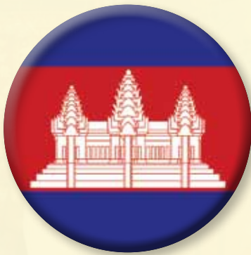
(Kingdom of Cambodia)