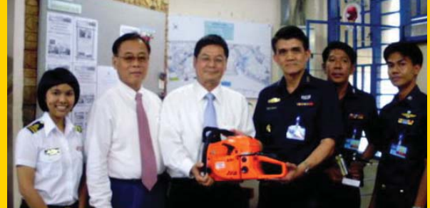
กรมช่างโยธาทหารอากาศ