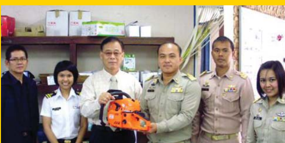
องค์การบริหารส่วนตำบลไทรน้อย