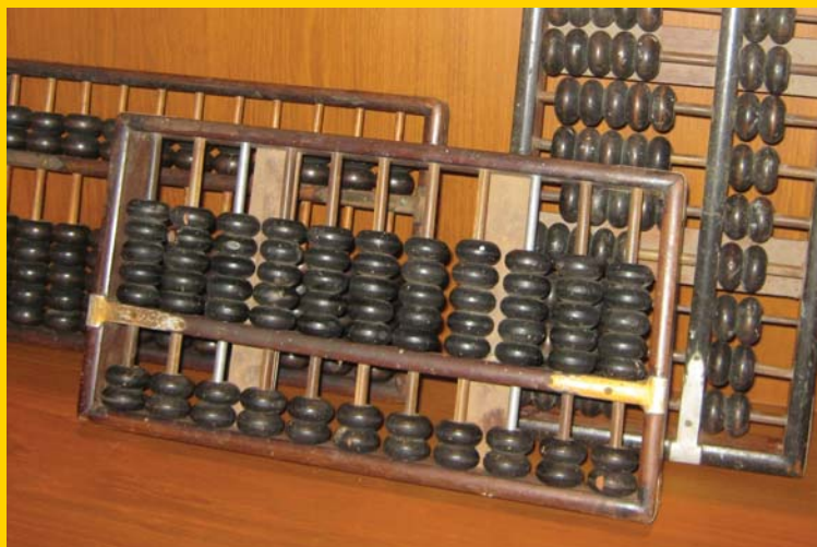
ลูกคิดโบราณ