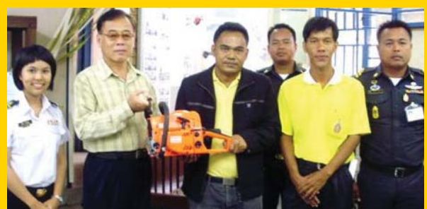
องค์การบริหารส่วนตำบลพิมลราช