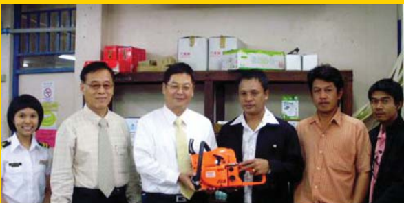
สำนักงานเทศบาลตำบลสุนทรภู์