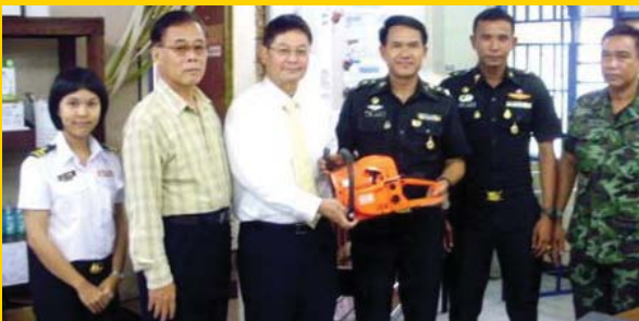
กองพันทหารปืนใหญ่ที่ 1 รักษาพระองค์