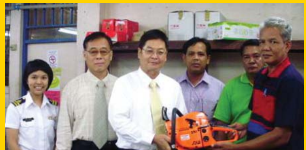
สำนักงานประมงจังหวัดชุมพร