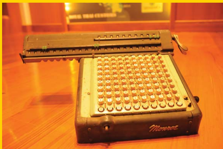
เครื่องพิมพ์ดีดโบราณ