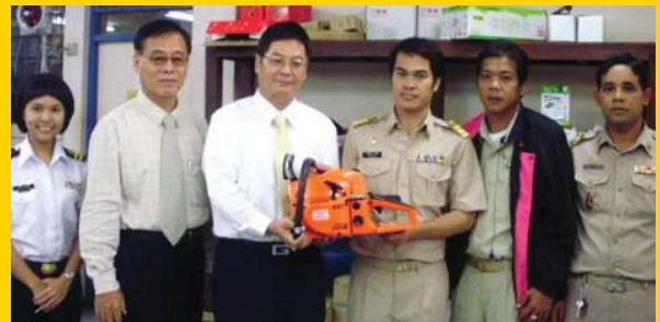
สำนักงานเทศบาลตำบลบางเตย