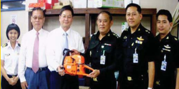
สำนักโยธาธิการ สำนักงานสนับสนุน สำนักงานปลัดกระทรวงกลาโหม

เมื่อวันที่ 5 และ 11 เมษายน 2554 ฝ่ายของกลางและของตกค้าง ส่วนควบคุมทางศุลกากร สำนักงานศุลกากรท่าเรือกรุงเทพ มอบของกลางเป็นเลื่อยโซยนต์ที่ใช้งานด้วยมือ (เฉพาะตัวเครื่อง) จำนวนทั้งสิ้น 73 เครื่อง รวมมูลค่ากว่า 51,100 บาท ให้แก่หน่วยงานราชการ 8 แห่ง