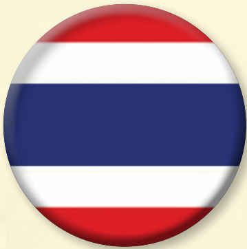
(Kingdom of Thailand)