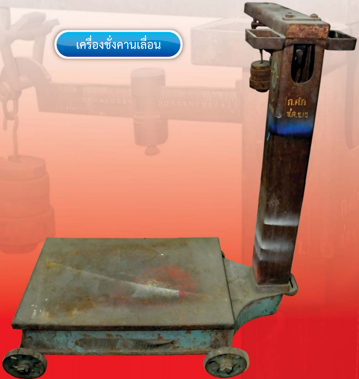
เครื่องชั่งคานเลื่อน