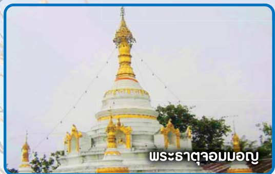
พระธาตุจอมมอญ