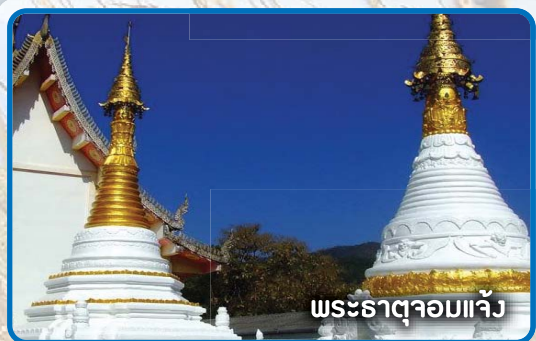
พระธาตุจอมแจ้ง