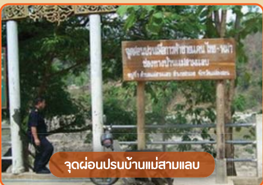
จุดผ่อนปรนบ้านแม่สามแลบ