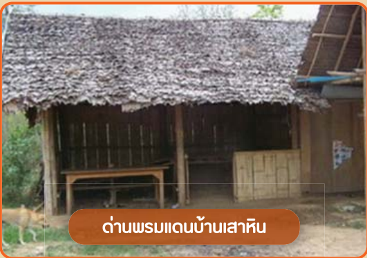
ด้านพรมแดนบ้านเสาหิน

2. จุดผ่อนปรนบ้านแม่สามแลบ ตำบลแม่สามแลบ อำเภอสบเมย เป็นการขนส่งสินค้าจากประเทศเมียนมาร์มายังประเทศไทย ทางแม่น้ำสาละวิน ระยะทางจุดผ่อนปรนถึงอำเภอแม่สะเรียง ยาวประมาณ 58 กิโลเมตร