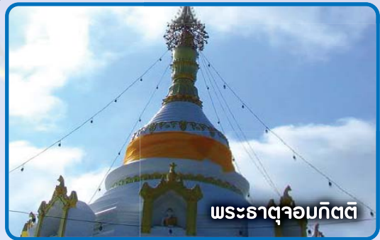
พระธาตุจอมกิตติ