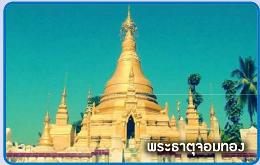
พระธาตุจอมทอง