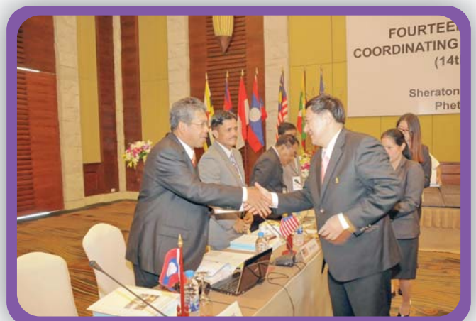
สำนักแผนและการต่างประเทศ

ที่ประชุมฯ ได้เชิญผู้แทนศุลกากรอินเดียมานำเสนอการให้ความช่วยเหลือระหว่างกันของศุลกากรประเทศสมาชิกอาเซียนและศุลกากรอินเดีย โดยอินเดียมีความประสงค์ที่จะให้มีการจัดทำความตกลงการให้ความช่วยเหลือระหว่างกัน ซึ่งประเทศสมาชิกอาเซียนขอนำข้อเสนอดังกล่าวกลับไปพิจารณาร่วมกับหน่วยงานต้นสังกัดของประเทศตนก่อน และจะแจ้งให้อินเดียทราบในโอกาสต่อไป