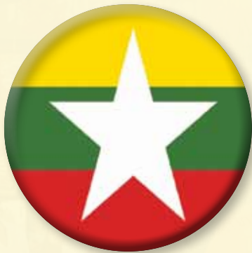
(Republic of the Union of Myanmar)

ประเทศเมียนมาร์ (Burma หรือ Myanmar) มีชื่ออย่างเป็นทางการว่า สาธารณรัฐแห่งสหภาพเมียนมาร์ (Republic of the Union of Myanmar) เป็นประเทศในเอเชียตะวันออกเฉียงใต้และคาบสมุทรอินโดจีนซึ่งมีขนาดใหญ่ที่สุด มีพรมแดนติดต่อกับ 5 ประเทศ ได้แก่ ไทย จีน ลาว อินเดีย และบังกลาเทศ ทางใต้ติดต่อกับทะเลอันดามันและมหาสมุทรอินเดีย จึงมีความอุดมสมบูรณ์ไปด้วยสัตว์น้ำและทรัพยากรทางทะเล พม่าจึงเป็นเสมือนประตูการค้า (Gate Way) ที่สำคัญของภูมิภาคนี้ ทำให้เป็นจุดหมายตของนักลงทุนต่างชาติ โดยเฉพาะอย่างยิ่งประเทศจีนที่ต้องการใช้พม่าเป็นเส้นทางการค้าที่ระบายสินค้าจากจีนตอนใต้ไปสู่ทะเลทางด้านทะเลอันดามันและมหาสมุทรอินเดีย เป็นเส้นทางขนส่งวัตถุดิบและน้ำมันเข้าสู่ประเทศเพื่อลดต้นทุนและความเสี่ยง