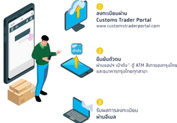
*หมายเหตุ หากในโลโก้มีสัญลักษณ์เป็นธงชาติ หมายถึง สามารถยื่นเรื่องผ่านเว็บไซต์หรือช่องทางอื่นได้