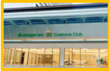
อาคารสโมสรศุลกากร กรมศุลกากร